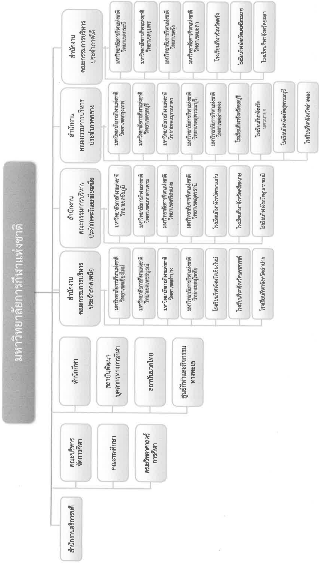
(ร่าง) โครงสร้างการแบ่งส่วนราชการของมหาวิทยาลัยกีฬาแห่งชาติ